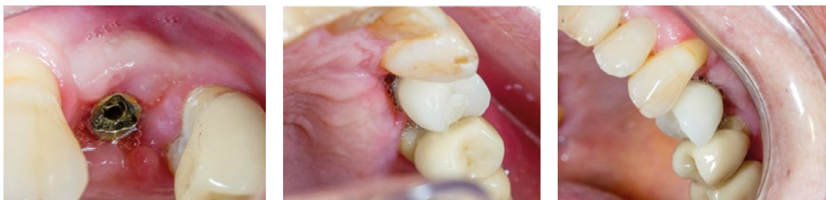
Fig. 5. Aspeto clínico da mucosa peri-implantar 15 dias após a intervenção cirúrgica.