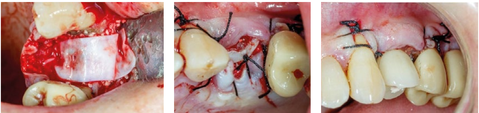
Fig. 4. Colocação de uma membrana reabsorvível Osgide® (Curasan®) e sutura a seda com pontos simples.