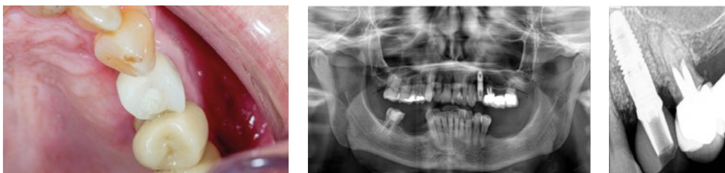
Fig. 6. Ortopantomografia e Rx periapical finais do implante de 2.4 com 12 meses de follow-up. Aspeto clínico onde se demonstra ausência da lesão palatina associada ao implante.

dos autores recomenda a cobertura do defeito regenerado com uma membrana reabsorvível 19 .